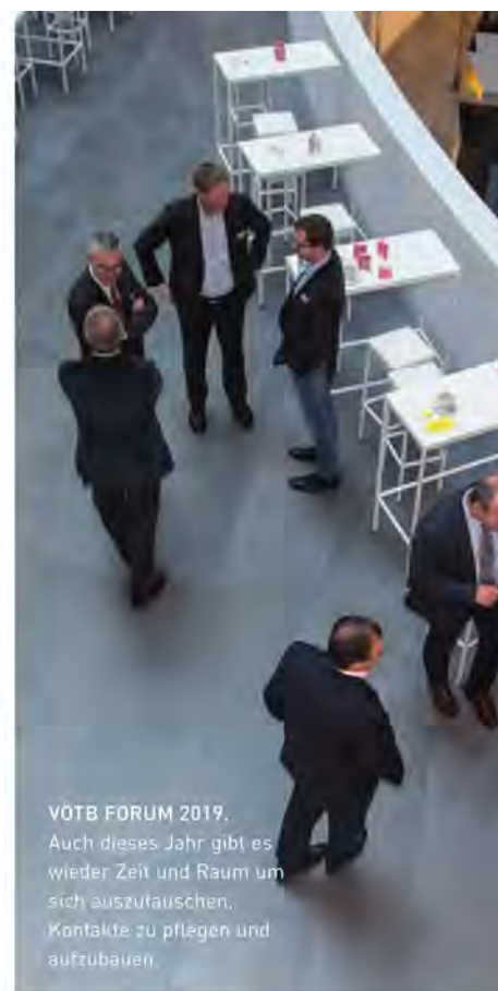
VÖTB FORUM 2019. Auch dieses Jahr gibt es wieder Zeit und Raum um sich auszutauschen. Kontakte zu pflegen und aufzubauen.

„Die Basis für eine erfolgreiche Unternehmenskultur sind die Werte und Einstellungen der einzelnen Mitarbeiter und deren Wirkung.“ Wie diese Unternehmenskultur auch von außen so wahrgenommen wird, erfahren die Teilnehmenden in seinem Vortrag.